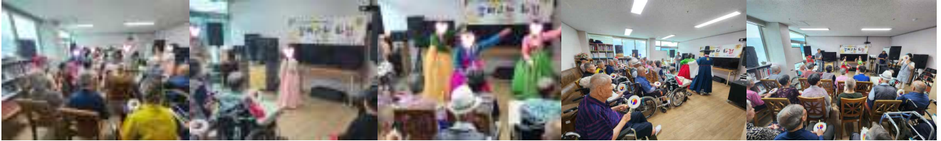
갑비고차 화접 공연단 방문공연